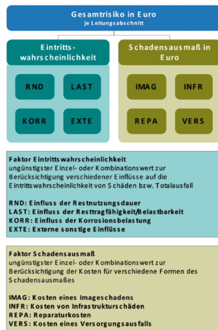
Abbildung 1: Hauptfaktoren zur Berechnung des Gesamtrisikos an einzelnen Leitungsabschnitten.

Eintrittswahrscheinlichkeit beschrieben werden (Haskins 2007). Bezogen auf Transportleitungssysteme kann dieses Risiko für beliebige Leitungsabschnitte anhand der in Abbildung 1 aufgeführten Faktoren errechnet werden. Die Innovation in der risikobasierten Bewertung liegt hierbei in der plausiblen Kombination deterministischer und probabilistischer Bewertungsmethoden, wie etwa Nutzungsdauerprognosen, statische Bauteilberechnungen (Rohrstatik), Zustandsbewertungen, georeferenzierte Analysen und