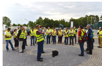
egeplast international GmbH, Greven