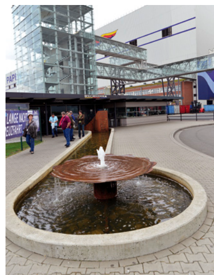
Meyer Werft GmbH, Papenburg

Im 15 km entfernt etwas einsam liegenden Land-Hotel Stegemann konnten wir uns beim Abendessen stärken und zum Austausch über den ersten Tag zusam-